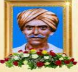
Tributes to Sri Komaram Bheem