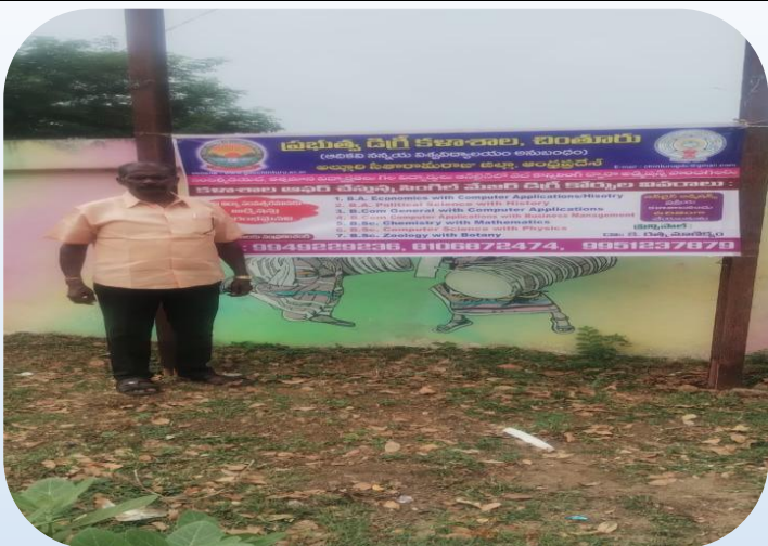
Flex display At Kothulagutta

International Day against Drug Abuse and Illicit Trafficking, an awareness programme was held at Degree college on Thursday. Participating as chief guest, Circle Inspector of Police, Chinturu explained the dangers of drug abuse and illicit trafficking and their impact on health and society. He stated that drug abusers suffer from harmful effects caused by drugs, humiliation and social discrimination they face. He explained that drug abuse not only impacts individuals and families but also society.