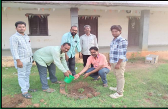
WORLD ENVIRONMENT DAY

Chinturu | Alluri Sitharama Raju District | Andhra Pradesh