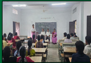
NEERU - MEERU