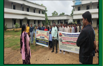
International Day Against Drug Abuse and Illicit Trafficking